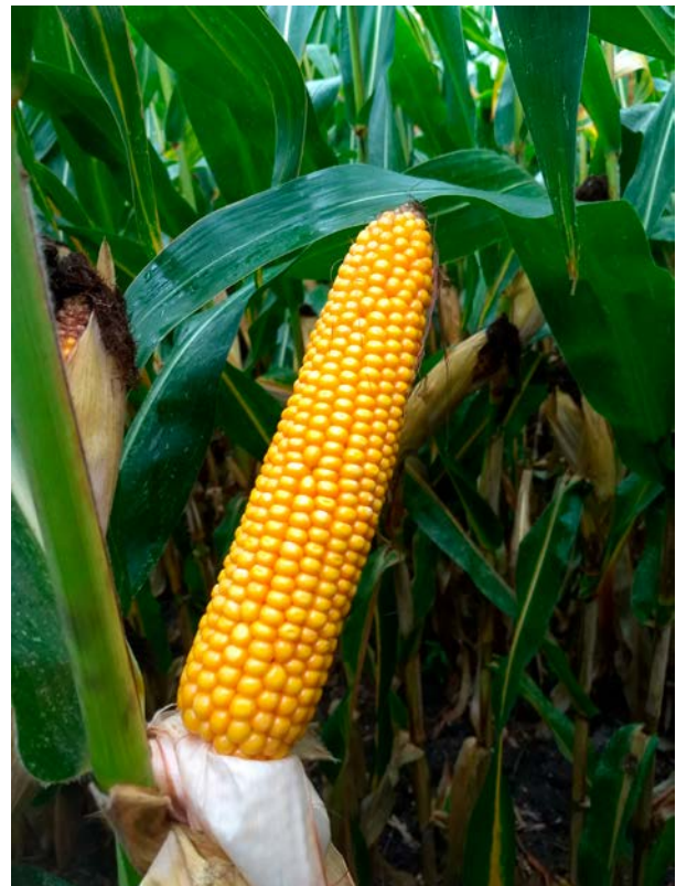
Kolf van ANOVI CS